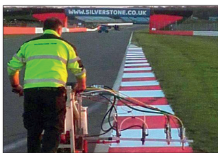
H9 Circuito Silverstone en Silverstone, UK