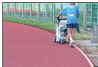
H5 Estadio olímpico en Roma, Italia