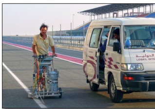
H5 Losail International Circuito en la Doha, Catar