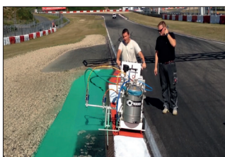
H9 Nürburgring en Nürburg, Alemania